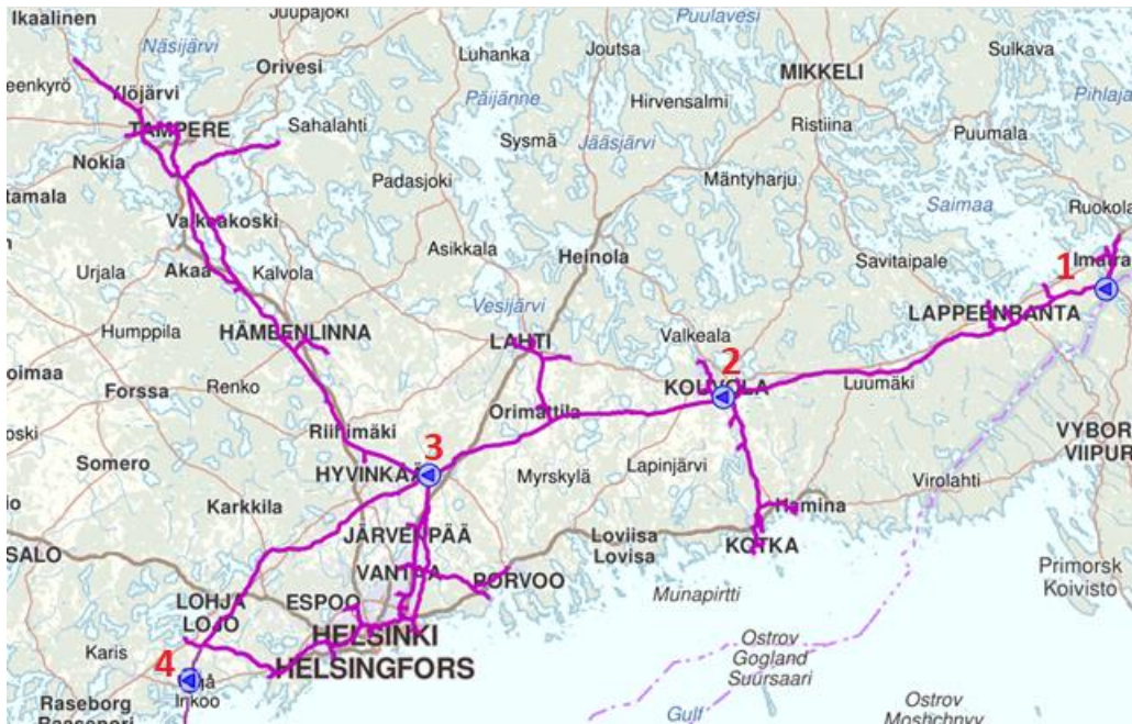
Kuva 2. Suomen kaasinsiirtojärjestelmä ja kompressoriasemat.

Kuvassa 2 on kuvattu Suomen kaasinsiirtojärjestelmä.